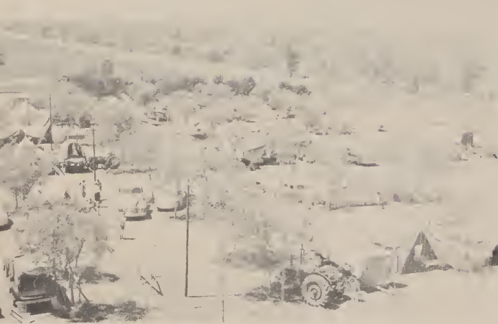
Die lidmate kampeer op die kerkplein vir die huidige kerkgebou, 12 April 1958.